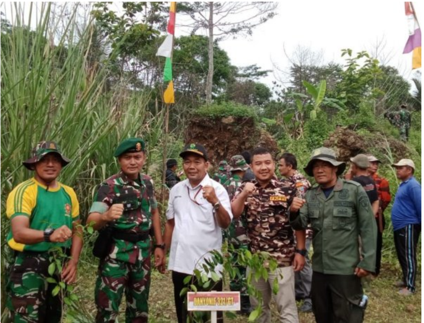
Tanam Pohon Bersama

MAJALENGKA - Kesatuan Pemangkuan Hutan (KPH) Majalengka menghadiri acara penanaman pohon bersama dengan Forum Komunikasi Pimpinan Daerah (Forkopimda) Kabupaten majalengka di Desa Pajajar, kecamatan Sindang Kabupaten Majalengka. Senin (15/01).